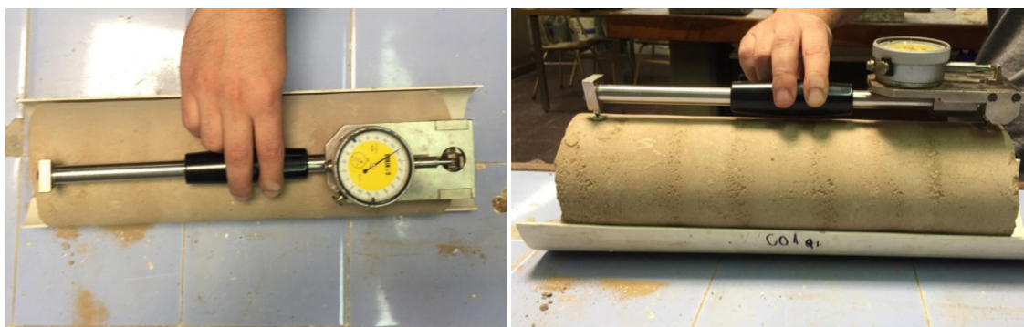
Figura 2. Medición de la variación de longitud debida a la retracción

El objeto de este análisis fue determinar la magnitud de la retracción volumétrica de las probetas moldeadas a fin de inferir potenciales diferencias entre la respuesta del suelo arena cemento, y del suelo arena cemento con incorporación de emulsión asfáltica. Para llevar a cabo este análisis, se diseñó una metodología consistente en medir variaciones de longitud de un segmento de definición previa. A partir de esta referencia y mediante sucesivas mediciones, es posible determinar la variación entre lecturas consecutivas por diferencia entre las mismas, la cual estará asociada además a un determinado período de tiempo. Para ello se utilizó un comparador de longitudes con una apreciación de 0,001 mm, aplicado sobre puntos de control materializados por medio de placas botón de aluminio adheridas (con resina epoxi) en la cara de la probeta, en una directriz definida previamente. La distancia entre los centros de esas placas (donde se aplica cada punto de apoyo del comparador) constituye el segmento que es monitoreado con las mediciones sucesivas. Para medir la variación de longitud de la probeta se eligieron dos directrices opuestas de modo de determinar en el promedio la evolución de deformación axial de la probeta llevada al eje de la misma. La frecuencia de medición fue determinada cada 24 hs, siendo relevante la magnitud acumulada de la retracción al cabo de los 7 días del período de curado (Figura 2).