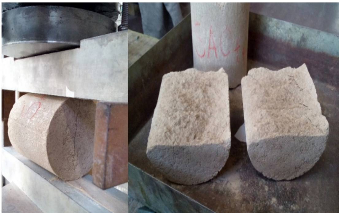
Figura 1. Ensayo y rotura de probetas a la tracción indirecta por compresión diametral

Las condiciones referidas a los periodos de curado y reposo, así como de inmersión, son las mismas que las establecidas para el ensayo de resistencia a la compresión simple. Los ensayos de resistencia a la tracción indirecta se realizaron con las probetas bajo una temperatura ambiente de 17°C.