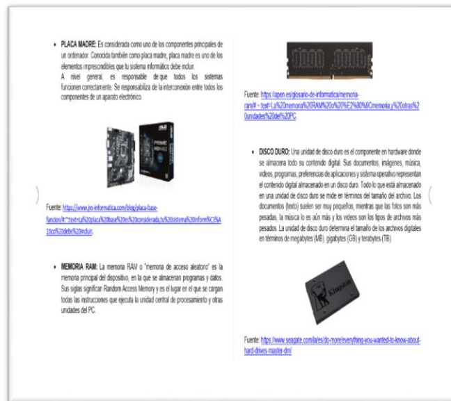
Figura 3. Ejemplo de componentes de la computadora.