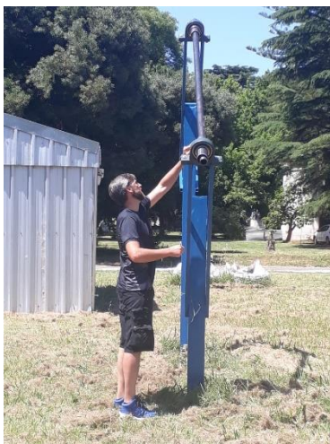
Figura 1. Vista frontal, receptor

Se participo en la investigación y desarrollo del dispositivo, específicamente en la caracterización de materiales, el diseño de la estructura, y el diseño del colector y el receptor; y en la realización del prototipo del sistema. Figura 1, 2,3.