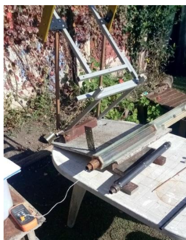
Figura 9, receptor hexágono