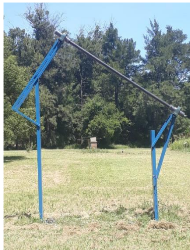
Figura 2. Vista lateral izquierda