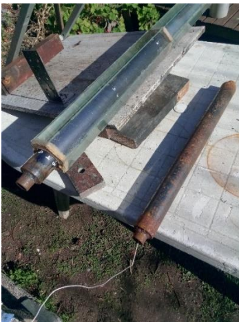
Figura 8, receptor testigo

Para la realización de ensayos de radiación se realizó un protector de vidrio de sección hexagonal con facetado vítreo para evitar pérdidas de temperatura y mejorar la eficiencia térmica en el receptor. Se utilizó un prototipo para la ubicación de las probetas 1 y 2 receptor, con una distancia focal entre 900 y 1000 mm. Entre el receptor y 1/16 (un dieciseisavo) de concentrador curvado reflectivo, de 50cm de ancho por 84cm de longitud y 4 mm de espesor, con curva parabólica de flecha entre 40 y 27mm con espejos curvados, (Fuqiang et al., 2017). Figuras 8, 9 y 10.