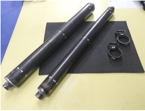
Figura 5, probetas para radiación solar.