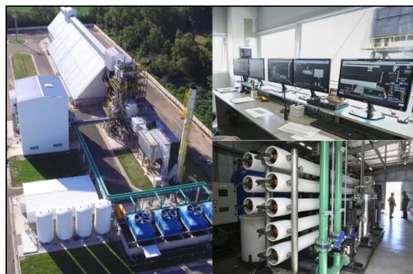
Figura 2. Planta de generación de energía eléctrica con biomasa

En 2017, esta empresa puso en marcha una planta de generación de energía eléctrica a base de cáscaras de maní (Figura 2). La usina cuenta con una turbina de vapor de 10 megavatios de potencia, con capacidad para generar 78.840 MW/hora. La empresa usa el 10% de la energía para su funcionamiento, el 25% para el proceso de industrialización del maní y el 65% restante se incorpora a la red nacional de electricidad. La energía obtenida por la transformación de esta biomasa se incorpora al sistema interconectado nacional, abasteciendo a 18.000 hogares por año. Para generar energía necesita aproximadamente 50.000 toneladas de cáscara de maní al año. Para ello, las cáscaras de maní se acopian en celdas y desde allí se trasladan a una caldera donde se quema y se transforma en energía potencial de vapor de agua, que se traslada a la turbina de vapor donde se convierte en energía mecánica de rotación, que acoplada al generador se termina transformando en energía eléctrica (PRODEMAN S.A., 2019).