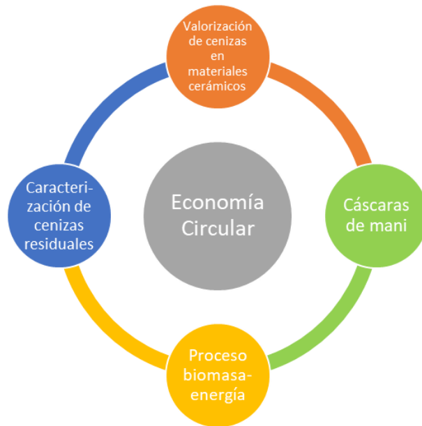
Figura 1. Esquema de las etapas de trabajo

En 2017, esta empresa puso en marcha una planta de generación de energía eléctrica a base de cáscaras de maní (Figura 2). La usina cuenta con una turbina de vapor de 10 megavatios de potencia, con capacidad para generar 78.840 MW/hora. La empresa usa el 10% de la energía para su funcionamiento, el 25% para el proceso de industrialización del maní y el 65% restante se incorpora a la red nacional de electricidad. La energía obtenida por la transformación de esta biomasa se incorpora al sistema interconectado nacional, abasteciendo a 18.000 hogares por año. Para generar energía necesita aproximadamente 50.000 toneladas de cáscara de maní al año. Para ello, las cáscaras de maní se acopian en celdas y desde allí se trasladan a una caldera donde se quema y se transforma en energía potencial de vapor de agua, que se traslada a la turbina de vapor donde se convierte en energía mecánica de rotación, que acoplada al generador se termina transformando en energía eléctrica (PRODEMAN S.A., 2019).