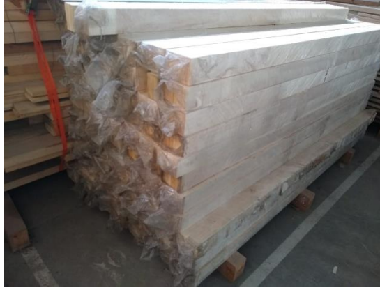
FIGURA 1: Acopio de madera 'Australiano 129/60' y 'Stoneville 67'

En primer lugar, se realizarán ensayos de flexión en el campo de las pequeñas deformaciones, destinados a determinar el módulo de elasticidad en flexión de las barras con esbeltez igual o superior a 70. Estas pruebas, que totalizan 160 probetas, se llevarán a cabo conforme a la norma EN 408 (2012) flexionando las barras alrededor del eje de menor momento de inercia. La aplicación de las cargas será la suficiente para lograr las deformaciones que permitan determinar el módulo de elasticidad global, pero sin afectar las propiedades mecánicas de la madera.